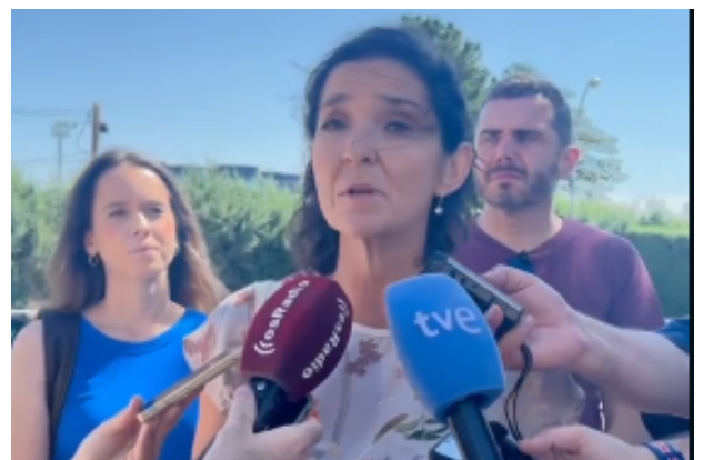
Reyes Maroto en declaraciones a los medios

Esta decisión se debe a trabajos de mantenimiento y reformas necesarias para mejorar las infraestructuras buscando garantizar la seguridad y calidad de los servicios ofrecidos a los usuarios en el futuro. El cierre incluye tanto las piscinas al aire libre como las cubiertas, que no estarán disponibles durante la temporada estival. Pero lo preocupante son las medidas que propone el Ayuntamiento como ir a otras instalaciones cercanas, compensaciones en los abonos de los usuarios afectados, con la consecuente preocupación de los residentes, que deberán ajustar sus planes estivales mientras se realizan las mejoras necesarias, una improvisación más del alcalde Almeida y su equipo de Gobierno.