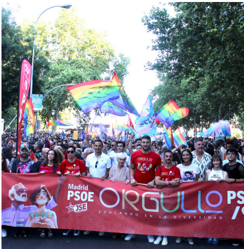
En la Manifestación del día del Orgullo en Madrid

El Tribunal Constitucional ha suspendido parcialmente la ley trans y LGTBI de la Comunidad de Madrid, a raíz de la petición del Gobierno central. Esta decisión afecta a varios aspectos de la legislación aprobada bajo la presidencia de Isabel Díaz Ayuso, que busca regular los derechos de las personas trans y LGTBI en la región. La suspensión es temporal y tiene lugar mientras el tribunal revisa la legalidad de la ley en su totalidad. El Gobierno de Pedro Sánchez había solicitado esta medida al considerar que la normativa madrileña podría vulnerar derechos fundamentales y principios constitucionales. La decisión del Constitucional destaca la tensión entre las competencias autonómicas y los derechos universales en el ámbito legislativo. Esta suspensión marca un punto crucial en el debate sobre la regulación de los derechos LGTBI en España.