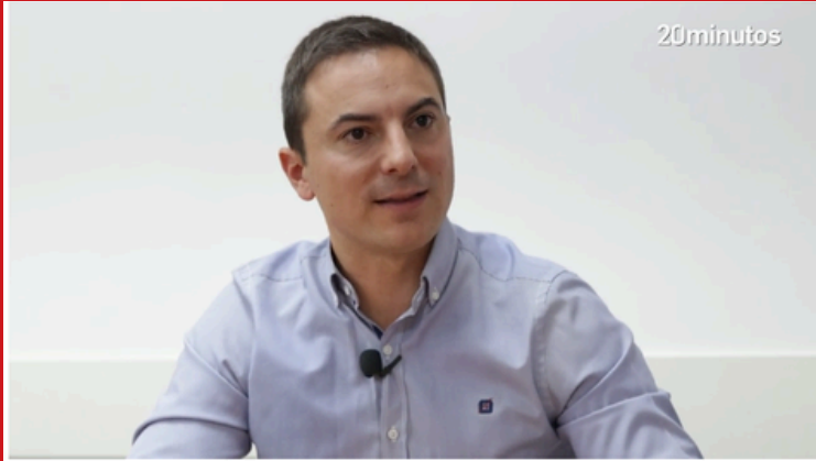
Juan Lobato en una entrevista de 20 minutos.

Es prioritario que actuemos sobre la sanidad pública: hay un millón de personas en listas de espera, 400.000 más de las que había cuando llegó Ayuso, y cientos de miles de familias sin sus urgencias de toda la vida en sus centros de salud.