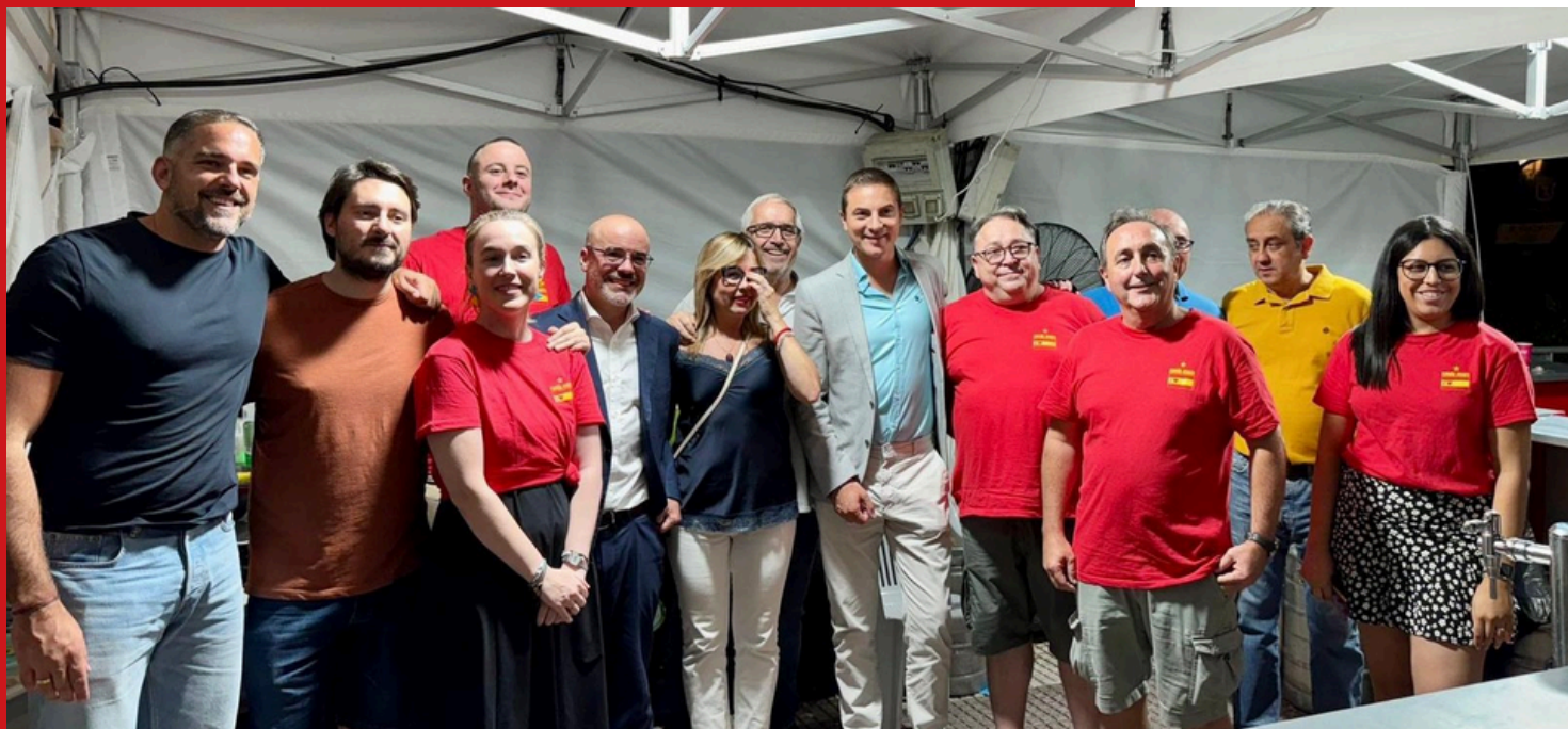
En el Barrio de Chamberí

MADRID CIUDAD: HACIENDO BARRIO EN LAS FIESTAS PATRONALES