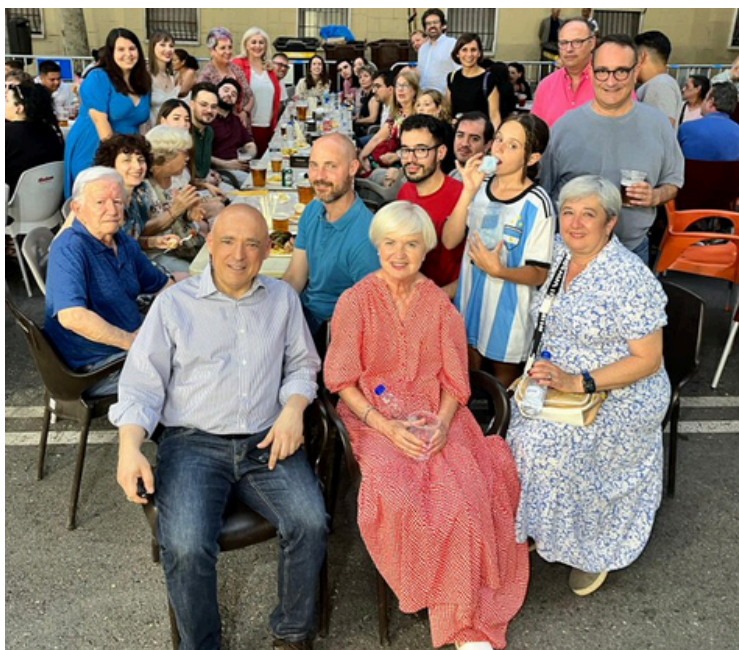
En el Barrio de Puente de Vallecas