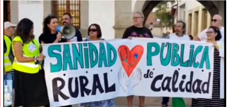
Vecinos de San Martín de Valdeiglesias en la concentración por la sanidad pública

Más de 200 personas se concentraron en San Martín de Valdeiglesias en una manifestación en favor de la Sanidad Pública. Los manifestantes protestaron por el gran deterioro que sufre el Centro de Salud local, donde actualmente ningún servicio está garantizado. Esta situación es especialmente preocupante debido a la ubicación geográfica de la localidad, que se encuentra a 40 minutos de carretera del hospital más cercano, atravesando un puerto de montaña.