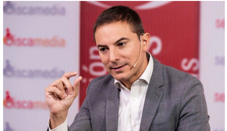
Juan Lobato en un momento de una entrevista en Servimedia

Por otro lado, Lobato critica a Alberto Núñez Feijóo por su falta de firmeza, señalando la influencia de Díaz Ayuso en sus decisiones, resaltando que el futuro político de España dependerá de la disposición del PP para reevaluar su enfoque y distanciarse de Vox, marcando así una diferencia clara entre las políticas democráticas y las tendencias extremistas