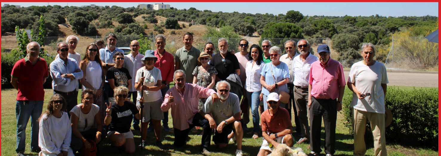
Juan Lobato, ha visitado Montegancedo en Pozuelo, acompañado de socialistas locales, de Boadilla y otros municipios cercanos, así como de vecinos y miembros de la Plataforma Salvemos Montegancedo

Juan Lobato, secretario general del PSOE de Madrid, visitó Montegancedo tras la paralización de las obras en la zona, expresando su satisfacción por la decisión judicial que impide la construcción, destacando la importancia de proteger los espacios naturales y criticó el proyecto, que consideró perjudicial para el medio ambiente y la calidad de vida de los vecinos. Además, subrayó la necesidad de políticas urbanísticas responsables que prioricen el bienestar ciudadano sobre los intereses económicos.