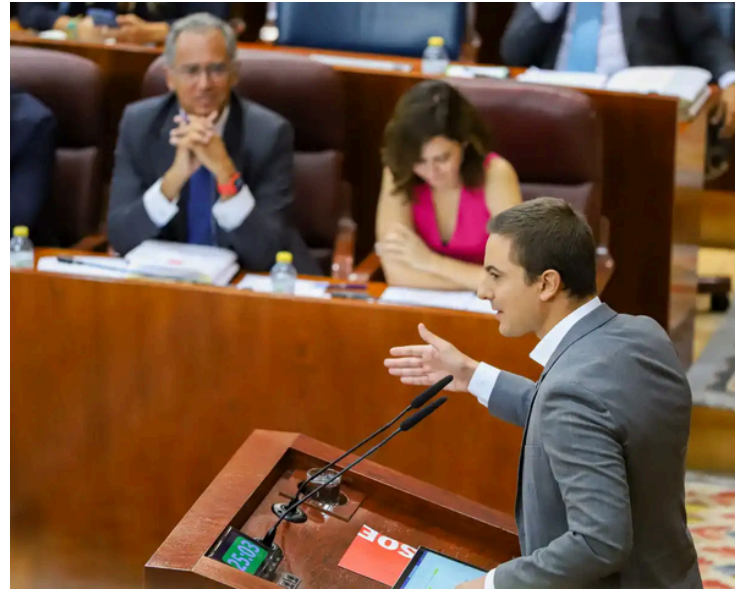
Juan Lobato en la Asamblea de Madrid

Es urgente adoptar medidas de "regeneración democrática" debido al actual clima político y la creciente tensión en España. En un contexto de polarización y desencanto ciudadano, Lobato ha destacado que las propuestas del presidente del Gobierno, Pedro Sánchez, que se presentaron en el Congreso de los Diputados, buscan responder a estos desafíos. Estas medidas están orientadas a fortalecer la transparencia y la participación, con el objetivo de restaurar la confianza en las instituciones y mejorar la calidad democrática. Lobato enfatiza que la regeneración democrática es crucial para superar las dificultades actuales y fomentar un entorno político más estable y constructivo.